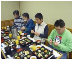
種類が多くて目移りします