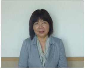
宜しくお願いします

まだまだ不慣れな事 が沢山ありますが、利 用者さんが一層楽しく ・居心地良く過ごせる 日中活動の場になるよ う、これから努めてい きたいと存じます。ど うぞ宜しくお願い致し ます。