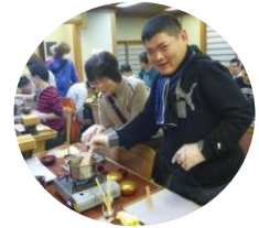
もちろんタレも手作り！